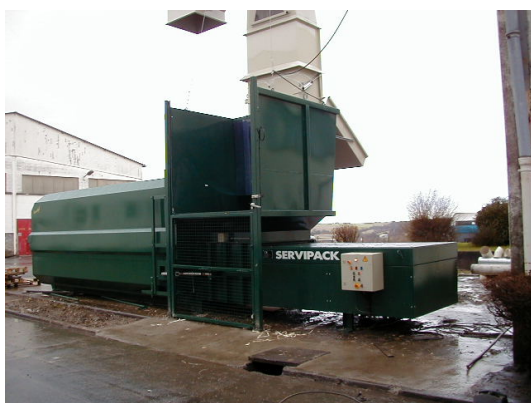
Tremie à double alimentation