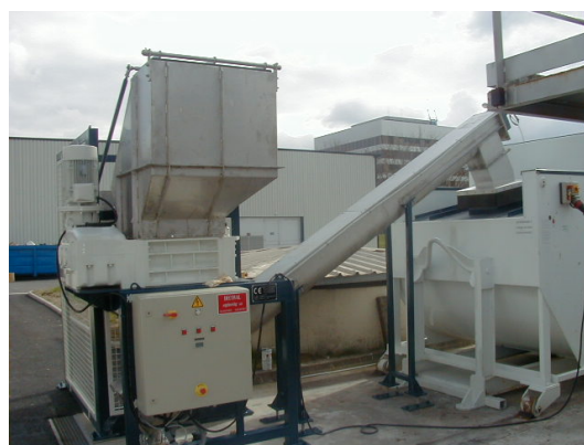
Broyeur et vis sans fin