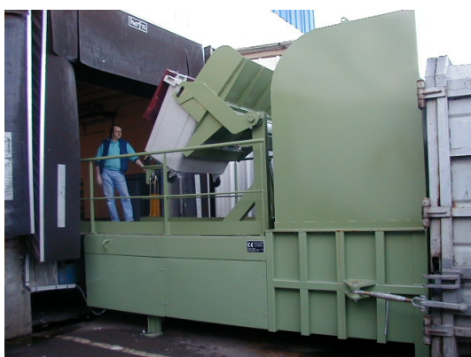
Mise à quai avec basculeur